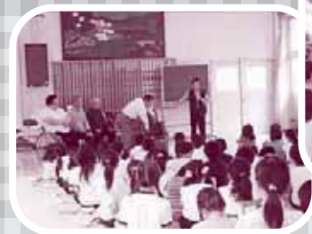
▲車イスの取扱について教わります

「車イスで段差を上るのが大変だったこの意見が多く聞かれました。また、車イス生活についてのお話を聞き、「車イスに乗っていても自分のしたいことができるのだと知った」と肢体不自由な人でも、周りのささやかな心遣いや手助けで行動の幅は広がっていく事を学びました。