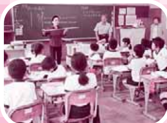
▲白杖について説明を聞きます

「目を開けていたらすべての道が目隠しすると遠くに感じた」、「怖かったけれど、ガイドの人がいたから安心できた」と目が見えないとはどういった感覚なのかを体験し、またガイドヘルパーの存在の重要性を学びました。