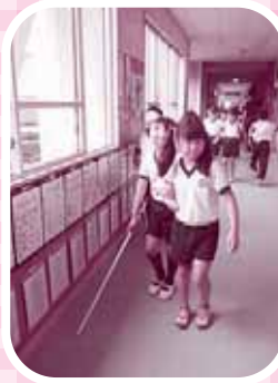
▲目が見えないと足がすくみずす