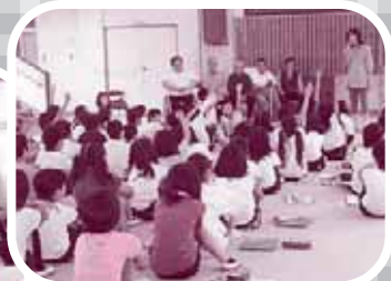
▲たくさんの質問が出ました