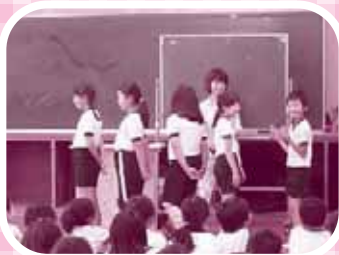
▼ジェスチャーだけで伝えます