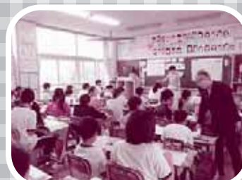
▲慣れない点字に戸惑いも…

点字を読んだり、点訳器を使って点字を書く体験だけでなく、街中にある点字の種類や役割についても理解を深めました。点字が視覚障がいの人にとってもどれだけ大切な物かを実感した児童が多いようでした。