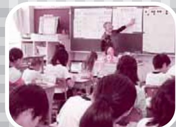
▲点字の仕組みについて学びます。